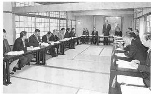
に終了となりました。

最初に、由良専務の司会の元、議案は全て可決承認されました。本年度は、優青会設立三十周年となり、九月に記