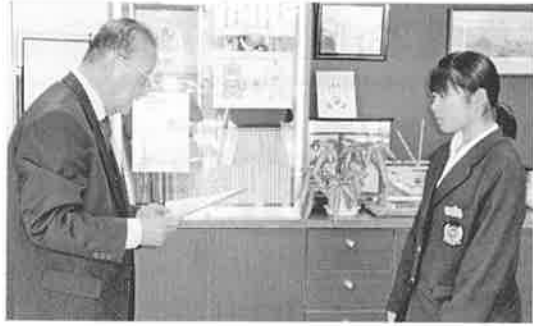
税の作文表彰伝達