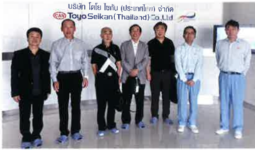
柏優会海外研修 東洋製罐

研修は、フルヤ工業さんと東証一部上場で、日本の容器業界最大手となる東洋製罐さんを視察しました。まず、東洋製罐さんは、元々は缶詰の缶や飲料の缶容器を製造されたのがスタート。世の中が変動する中、容器会社という方針の下、プラスチック容器を手がけられ、一部の取引先とは、中身の充填作業まで受託される等の変遷を重ね、子会社66社で、容器業界世界第7位になったとの事。製品は、町ぐるみ健診の大腸検査容器やキューピーマヨネーズ、練りわさびの容器等、目にした商品がたくさんありました。約200m×200m建屋が