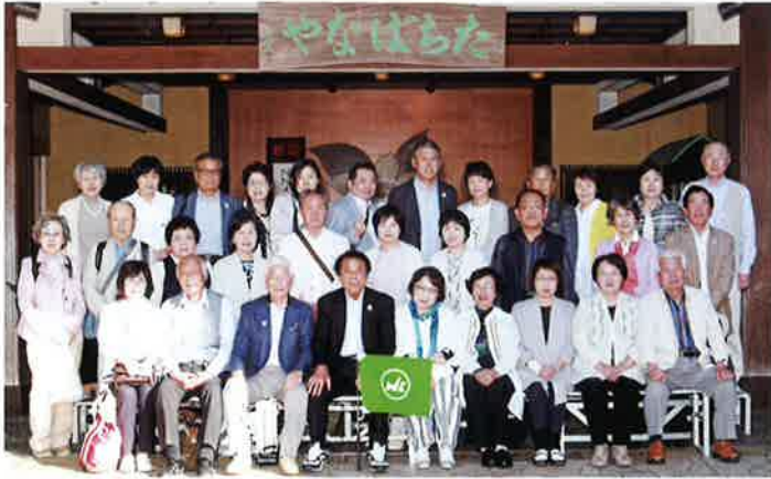
南東北の名湯 あつみ温泉「たちばなや」

納税協会の旅行は毎年参加していますが旅行の二、三日前、事務局より旅行の原稿をと言われたとたんに旅行の楽しみが?.....と言うのは文章作るのが大の苦手です。