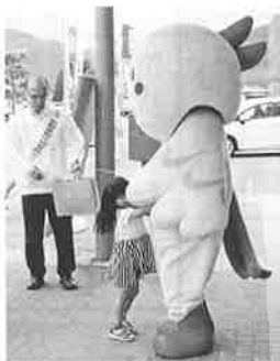
5月には自動車税納期前納付キャ ンペーンを行いました。兵庫県マ スコット「はばタン」も一緒です。

間税を賦課する課税第2課の 4課体制で20数名の職員が勤 務しています。兵庫県の県税 事務所の中で、一番規模の小 さい事務所ですが、その分職 員のまとまりはよく、最も雰