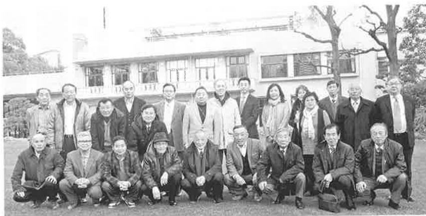
ザ・ガーデンオリエンタル大阪

日本銀行では、厳重な警備の中「発券銀行、銀行の銀行、政府の銀行」の業務内容を説明してもらいながら、日本銀行券（お札）の歴史を学びました。