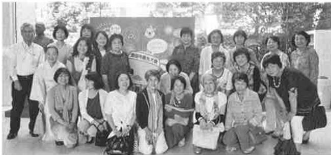
インスタントラーメン発明記念館