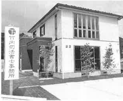
竹内司法書士事務所

資産、権利を守る確かな法務サービスの提案をさせていただいております。ご厚誼いただきますようお願いいたします。