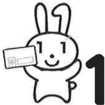
例1 マイナンバーカード