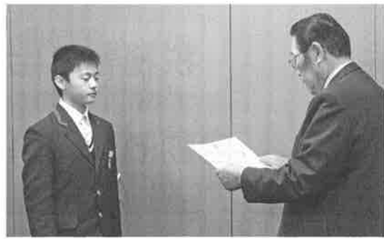
税の作文表彰伝達