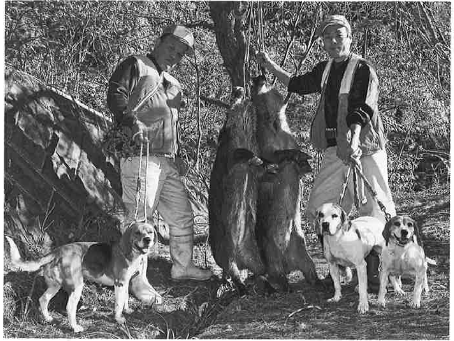
父の二三男さん(左)と