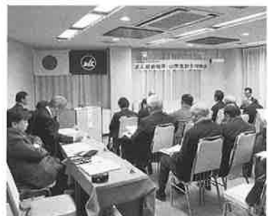
法人部会柏原山南支部合同総会