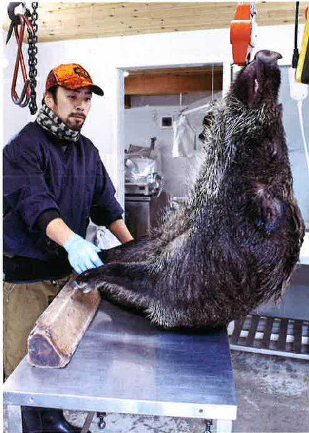
イノシシをいねいに解体