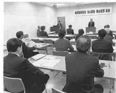
法人部会篠山支部総会

次のとおり、支部総会が開催されました。 第一部 事業報告と収支決算、事業計画と収支予算 第二部 税務研修会 第三部 意見交換会