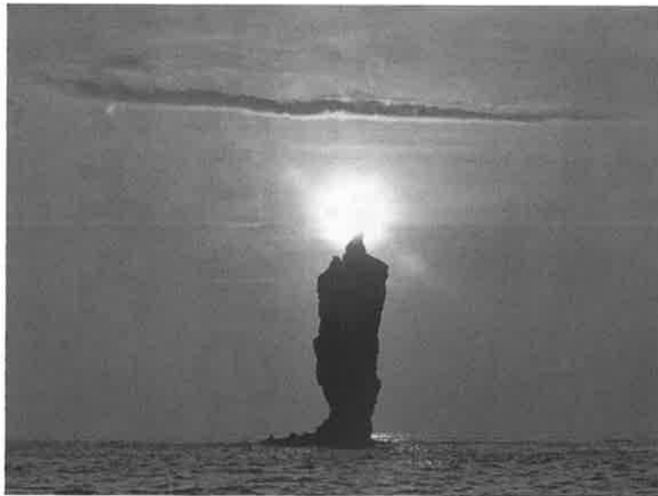
隠岐の島の観光名所「ローソク島」

の後押しを受けて一人の医師が内科医から産婦人科医に転身して隠岐の島に赴任され、また島の熱血ベテラン助産師たちの奮闘もあって、今では島での出産が可能になったそうです。次女は離島医療の大変さと、情熱的な医師・助産師たちから多くの事を学んでいました。 さて、丹波市も隠岐の島も日本が近い将来に直面する本格的な高齢化社会の先進地です。