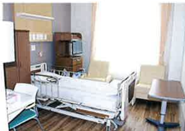
床が木目調の病室