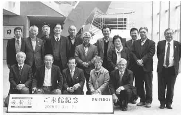
ご来館記念 2019年3月7日 DAIFUKU

や安全対策にも温かい人間的な配慮も感じられました。施設を案内して頂いたお嬢さん(？)の説明も立て板に水で、意地悪なおじさんの質問にも笑顔でさらっと受け答えして頂きました。まだまだ我々にとっては今回のシステム導入は規模、費用対効果面等で時間がかかるかも知れませんが、物流、人的コストダウンの考え方に多くのヒントを頂き、大変有意義な研修となりました。 帰丹後は、大和さんの美味しい料理とお酒を頂き、一同ご満悦にて無事閉会致しました。山内副会長さんには色々お世話になり有難うございました。