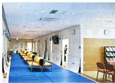
ミルネ健診センター