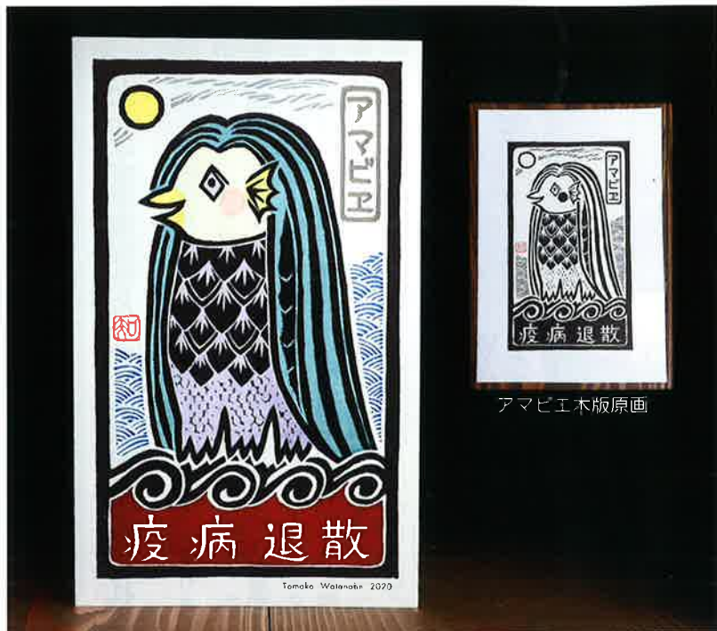
アマビエ木版原画