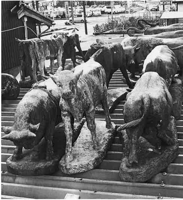
自宅倉庫屋根に並ぶ2代目柏里のウシ