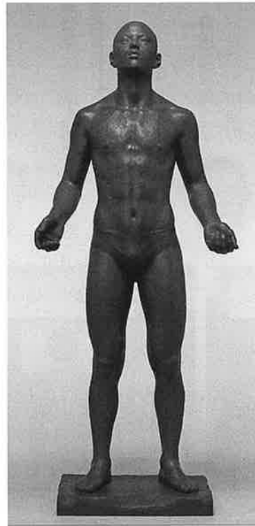
3代目柏里作「明日へ」 (日展2回目の特選)