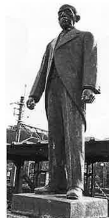
田ステ女像(上)、 田艇吉翁像(下)は 初代柏里作

らはそれとなく伝わってきま した。でもあまり真剣には考 えておらず、高校に入った時 も初めは卓球に熱中していま したが、美術教師だった叔父