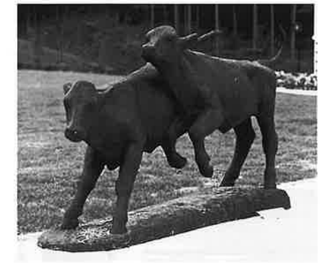
2代目柏里作「牛舎を出るべく」

すし、やさしそうでかつ精悍な感じを出すことがポイントです。台部も別でなく一木作りですので、ウマなどに比べて足が短く台部との間隔が狭いので苦労します。立っているウシはその部分だけで大方