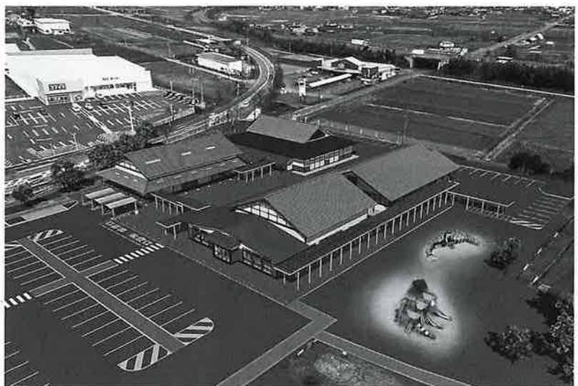
来年3月にリニューアルオープン(完成予想図)

工品を開発中。同施設は年間25万人の来場を基に設計されたが、2019年時点で37万人とはるかに突破。国土交通省から全国で百カ所余りある「重点道の駅」に指定され、有利な助成が受けられるようになったこともあり、全面的な改修工事に着手。今年3月にリニューアルオープンをめざす。