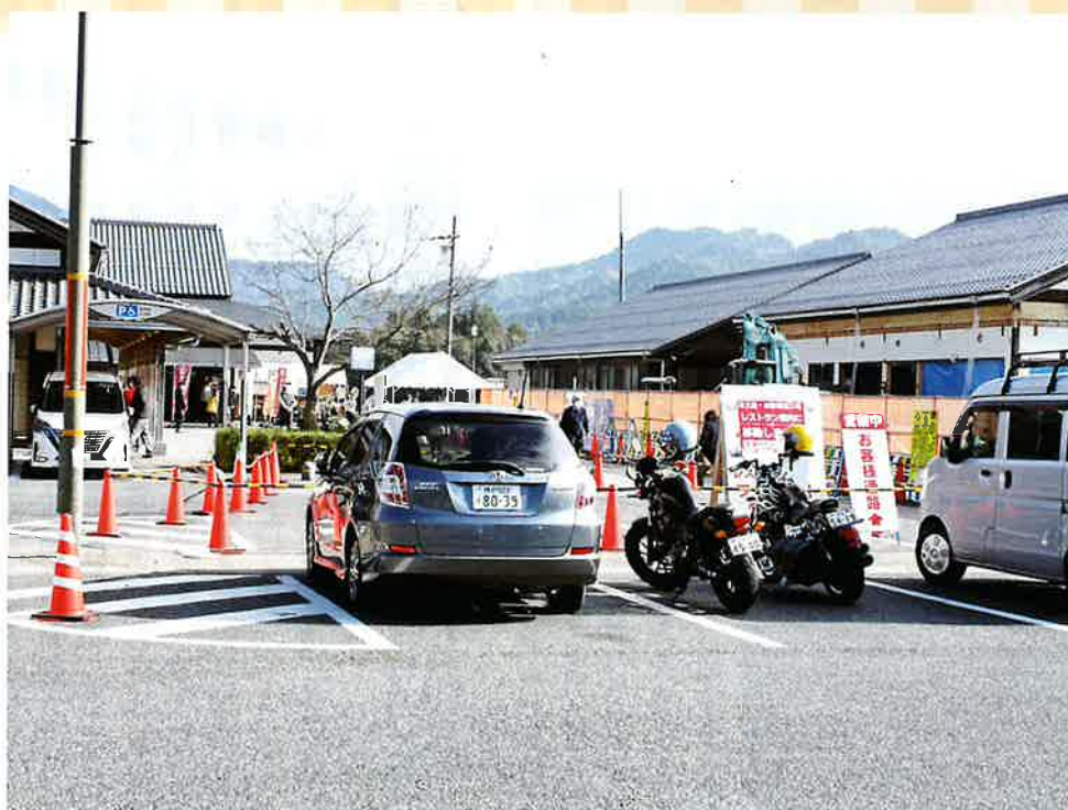
今春に向けて物産館(右側)の増築工事が進む

舞鶴若狭自動車道春日インターそばで特産品の物販、飲食店を運営する観光施設「道の駅・丹波おばあちゃんの里」が健闘している。地域の農家から集めた野菜市などが阪神などからの顧客に評価されてきたため、新型コロナウイルスの中でも売り上げはピーク時の水準をほぼ維持。今春から売り場面積を倍増するなどのリニューアルオープンをめざす。今後の戦略などについて聞いた。(広報部会 小田晋作)