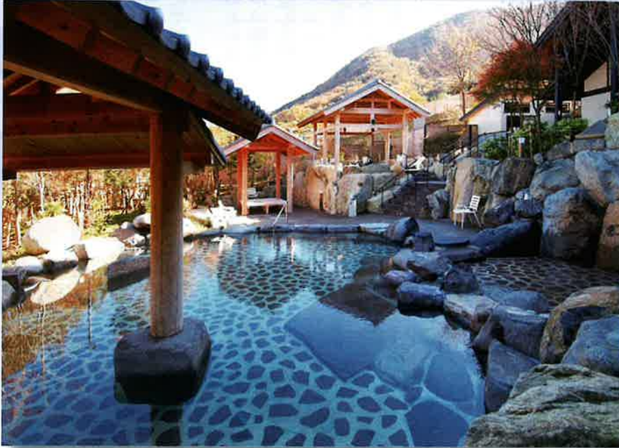
「道の駅」として整備されることになった「ぬくもりの郷」の大露天風呂

丹波篠山市今田町今田新田にある「こんだ薬師温泉 ぬくもりの郷」が、令和8年度の開業をめざして「道の駅」として整備されることになりました。同温泉は、19年前の平成16年にオープン。以来、経営状況は浮き沈みを経験し、新型コロナウイルスの収束の動きに今後の光が見え始めた中、道の駅として施設が拡充されることになり、関係者らの期待が高まっています。 湧出量が毎分約600リットルと、県内でも有数の湯量を誇り、源泉かけ流しの日帰り温泉施設としては規模が飛び抜けていることもあって、開業そうそう注目を集め、予想を上回る入湯者で賑わいを見せました。開業初期には1年間の入湯者が40万人を超えました。しかし、徐々に入湯者が減少。過剰投資をしたことも裏目になり、経営