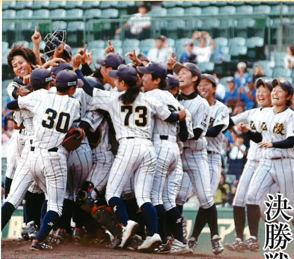
昨年の夏、甲子園球場で行われた全国高校女子硬式野球選手権大会で優勝し、歓喜の輪をつくった神戸弘陵学園高校の選手たち