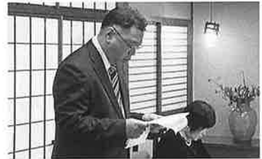
R 5.12.6 個人部会氷上支部研修会