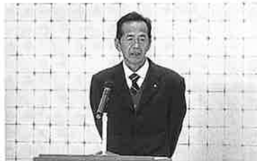
R 5.12.11 個人部会篠山・丹南・西紀支部合同研修会