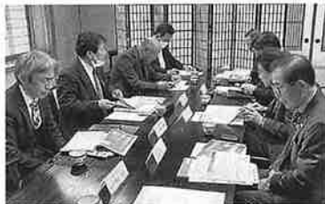
R 5.11.28 法人部会山南支部研修会