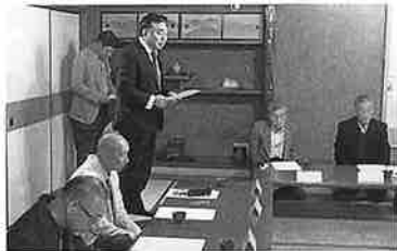
R 5.11.2 法人個人青垣支部合同研修会

本年度も各支部が支部研修会を開催いたしました。 柏原税務署より税務署長様・法人統括官様・個人統括官様をお招きして『電子帳簿保存法について』『e-TAXを利用した申告について』研修会を開催いたしました。