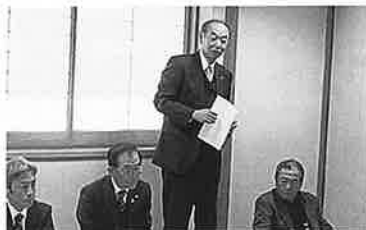
R 5.11.20 法人個人山東支部合同研修会