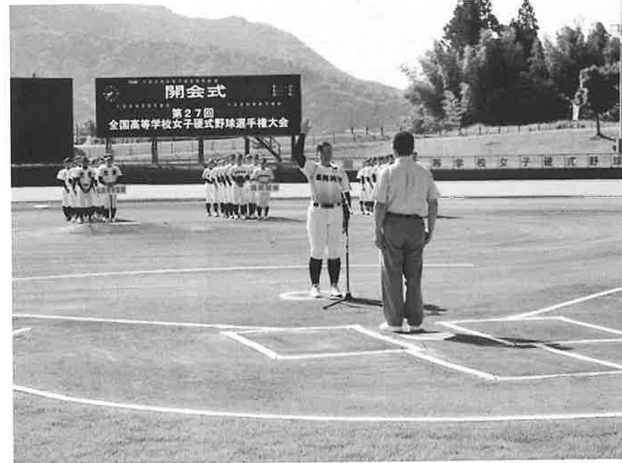
昨年、スポーツピアいちじま（つかさグループいちじま球場）で行われた夏の大会の開会式で選手宣誓をする選手

い」と私財を投じて大会を開催し、全国高校女子硬式野球連盟を立ち上げた人だった。四津氏に出会い、その情熱に感動した男性は、「市島町で春の選抜大会を開催できないか」と町内の有志に呼びかけた。スポーツピアいちじまが2000年春に完成するのに向けて、オープンリーグイベントを模索していた時期だった。有志たちは提案に賛同。町内の関連団体で組織を立ち上げて動き出した。四津氏にも何度も出会い、話し合った。四津氏は「春と夏の年2回、大会があれば、女子球児も張り合いが持てる」と快諾してくれた。こうして2000年