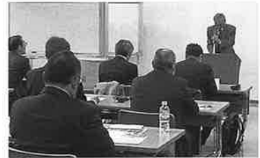
R 5.12.18 法人部会篠山支部研修会