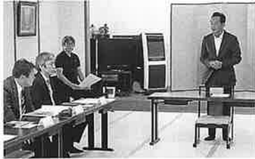
R 5.10.24 法人部会丹南支部研修会

本年度も各支部が支部研修会を開催いたしました。 柏原税務署より税務署長様・法人統括官様・個人統括官様をお招きして『電子帳簿保存法について』『e-TAXを利用した申告について』研修会を開催いたしました。