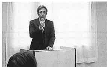
R 5.12.8 法人個人柏原支部合同研修会