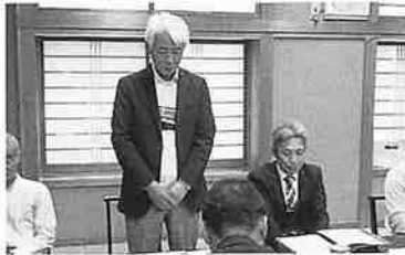
R 5.11.6 個人部会山南支部研修会