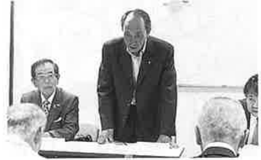
R 5.11.10 法人個人部会今田支部合同研修会