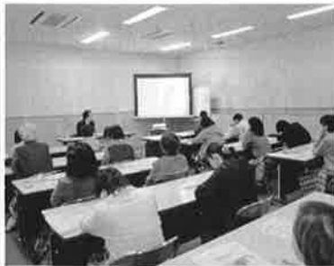
篠山市民センター