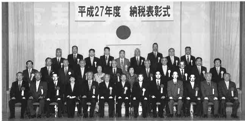
平成27年度 納税表彰式