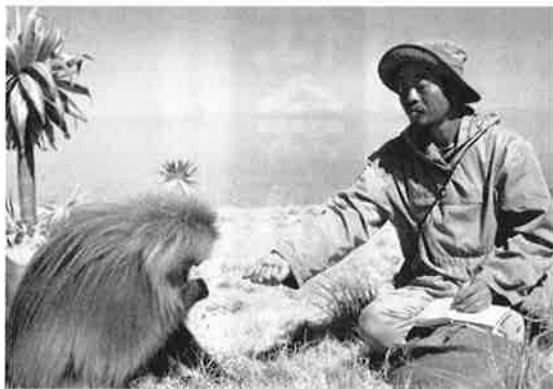
プレゼントを持ってご挨拶 (1973年)

スは力が衰えてきて抑えがきかなくなりそうになったり、さっさと群れから離れ、ヒトリザルになるか他の群れに行ってしまう。その身の処し方は見事なものです。霊長類の生態や社会の研究は戦後、日本で始まりました。1967年に京大霊長類研究所が犬山に出来、私はそこへ移って定年後はJMC所長となり46年間、犬山にいました。その間、アフリカのコンゴやカメルーン、エチオピアに