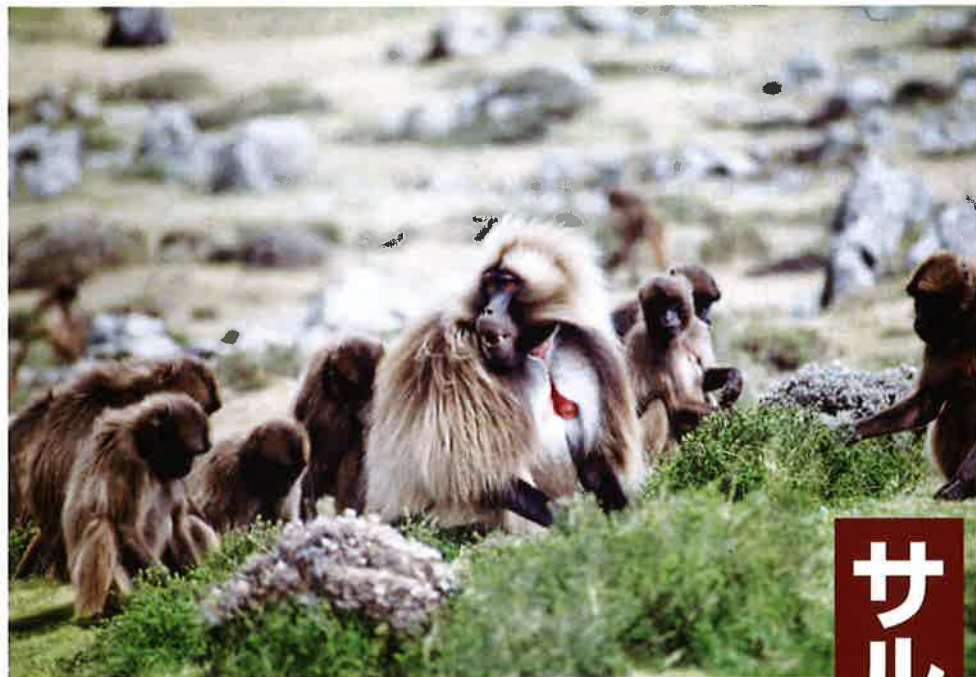
ゲラダヒヒのボス (エチオピア・セミアン高地で)