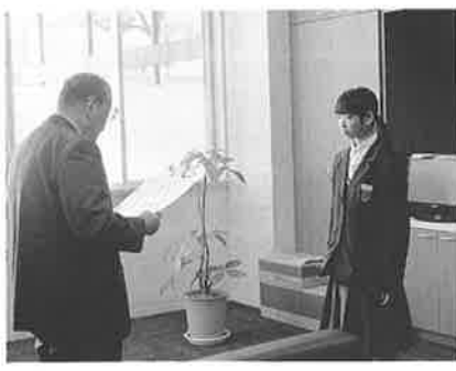
税の作文表彰伝達