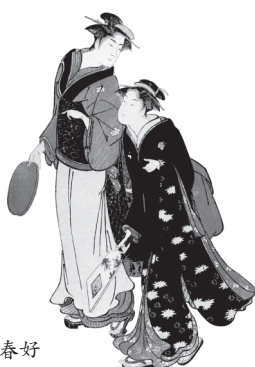
羽つき / 勝川春好

上京区土屋町通丸太町上ル 小山町九〇八—六七 税理士 渡邊 重樹 電話 八四二—二九一三