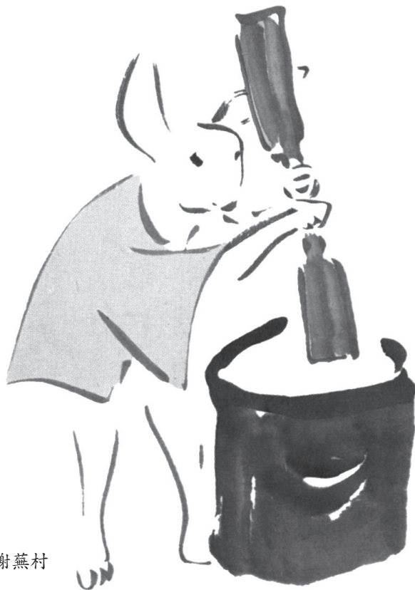
兔 / 与謝蕪村