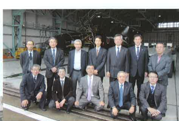
◇葛城法友会管外視察研修 日時・11月18日(水) 10時 場所・航空自衛隊 岐阜基地