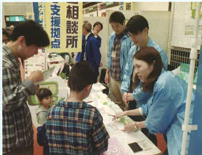
◇大和高田・橿原・葛城くらし産業メッセ2015 日時・11月7日(土)・8日(日) 10時 場所・奈良県産業会館