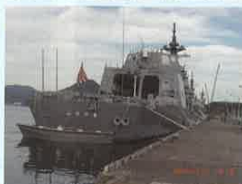
◇《青色申告部会・葛城優青会》 青色申告部会・葛城優青会管外視察研修 日時・12月2日(水) 10時 場所・海上自衛隊 舞鶴基地