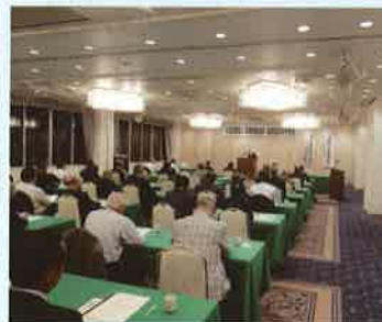
◇青年部会役員会 日時・11月30日(月) 19時 場所・旬菜かづ ◇《資産税部会》 資産税部会研修会(講演会) 日時・10月26日(月) 16時 場所・権原観光ホテル