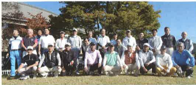
《葛城法友会》 ◇第5回奈良県下優良申告法人会合同親睦ゴルフコンペ (主管 葛城法友会) 日時・10月16日(金) 9時3分順次スタート 場所・秋津原ゴルフクラブ