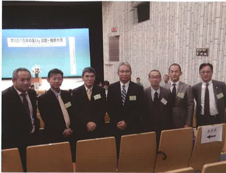
◇第8回「青年の集い」淡路・播磨大会 日時・11月25日(水) 14時 場所・姫路市民会館・ホテル日航姫路