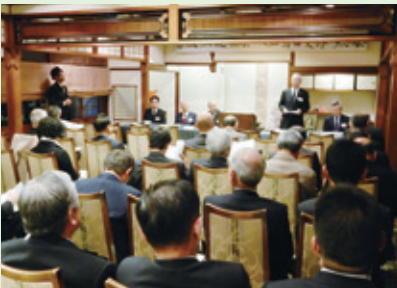
大和高田支部総会