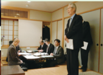
高市支部年末研修会