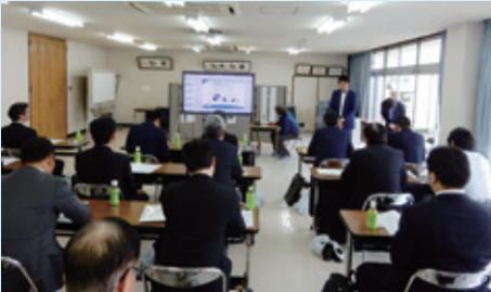
共同精版印刷株式会社