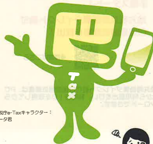
国税庁e-Taxキャラクター： イータ君

国税の場合はe-Tax、地方税の場合は eLTAXを利用して、事前に届出をした 預貯金口座からの振替により、簡単な 操作で税金を納付することができる 便利な電子納税の手段です。