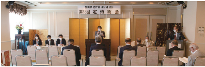
長田納税貯蓄組合連合会総会風景

事業活動については、引き続き、税に関する作文・書道・ポスター募集を通じた児童・生徒に対する租税教育活動、e-Tax・ダイレクト納付の利用拡大に積極的に取り組むこととしました。