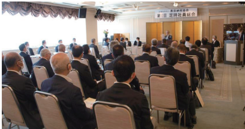
長田納税協会定時社員総会風景

引き続き、会員の福祉の増進と、納税協会の財政基盤の確立に寄与された大同生命保険㈱の職員2名とAIG損害保険㈱の職員1名に、会長から感謝状が贈呈されました。