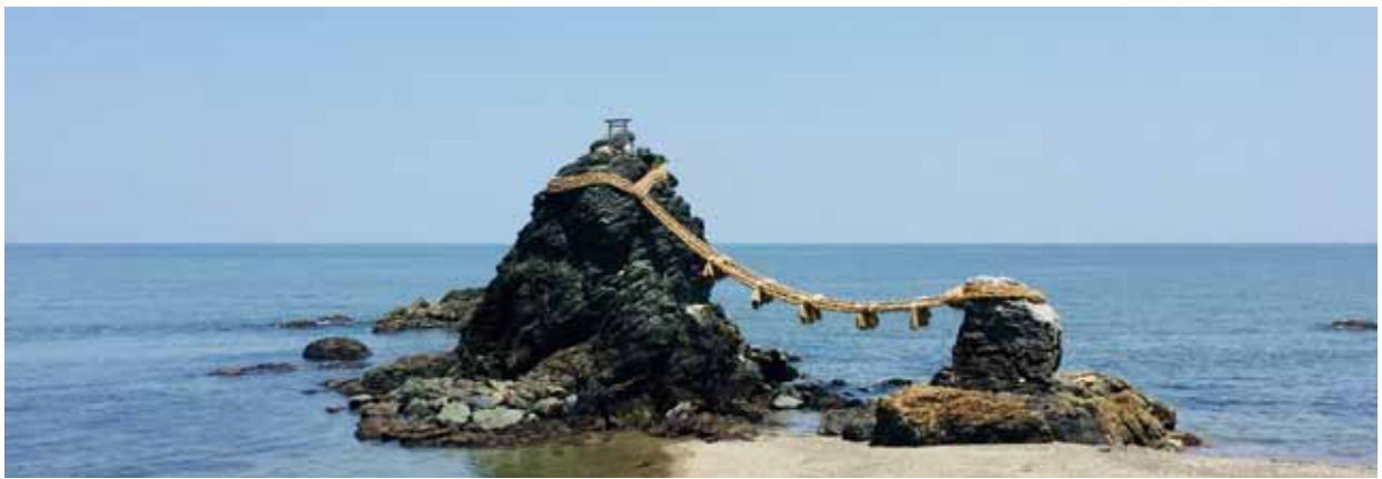
夫婦岩（三重県伊勢市）