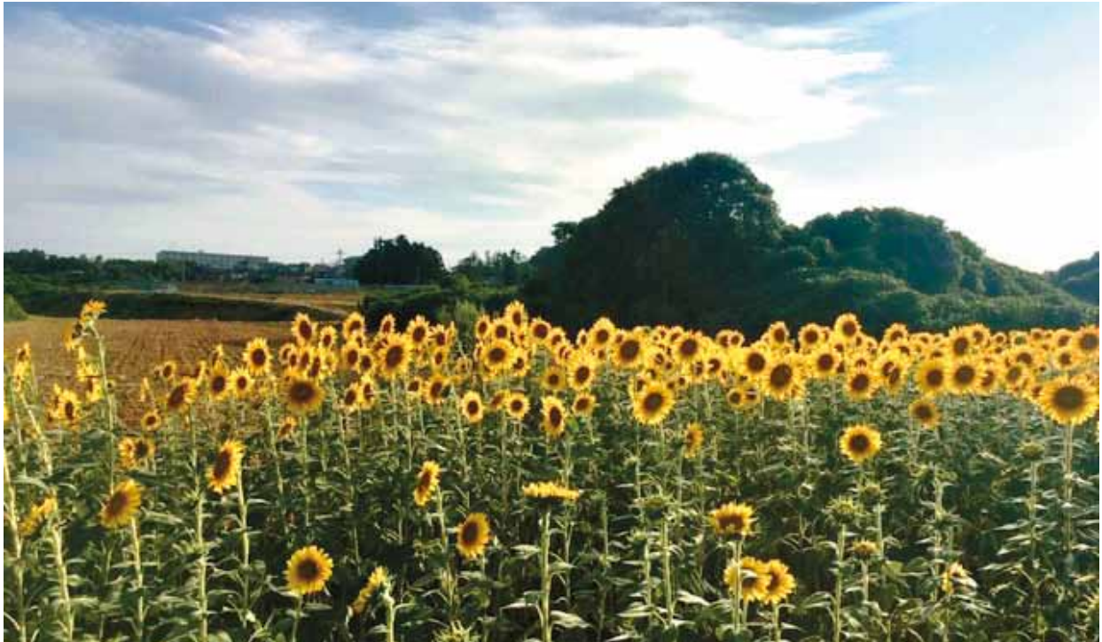
ひまわり畑 (福井県 あわら市)