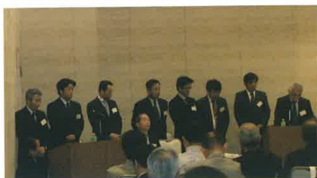
新役員代表あいさつ