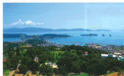
日本のエーゲ海 岡山県牛窓町

話がそれてしまったが、最近のナビは目的地への検索はもちろん、ドライブレコーダーとETCとの一体化など、一昔前では考えられなかった最新技術が搭載されるようになり大きく進化した。しかし自分はアナログ人間だから、今後もナビに支配されることなく、頭の中の地図と勘を信じてドライブを楽しもうと思うのである。