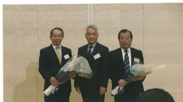
退任された前川氏と片岡氏