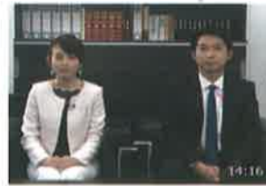
遺精請求書等保存方式の概要【平成30年9月配信】