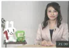
消費税の軽減税率制度に対応した経理・申告ガイド【令和元年8月配信】