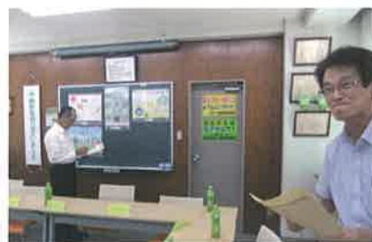
【小学生の書道・ポスター選考会】