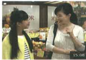
日常生活と軽減税率制度【平成30年9月配信】