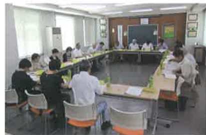
【中学生の作文選考会】