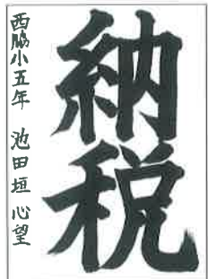
西脇5年 池田垣心望