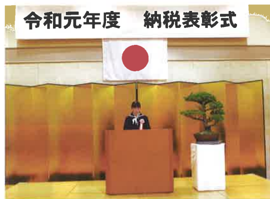
★この作文は11月13日の納税表彰式典で朗読披露されました。

私は、今回のお話を聞いて自分も大人になったら税金をただ納めるだけでなく、税金の必要さをよく理解したうえで納められるような人間になりたいと思います。そして、これまで納めてこられた方や今現在納めておられる方に感謝して、今まで以上に教科書はもちろん、学校や公共施設を大切に使っていこうと思います。