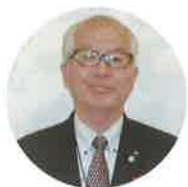
西脇市教育長 笹倉邦好