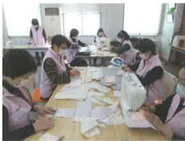
マスクづくりに励むメンバー