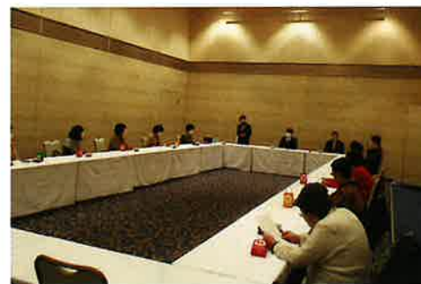
うららの会事業報告会