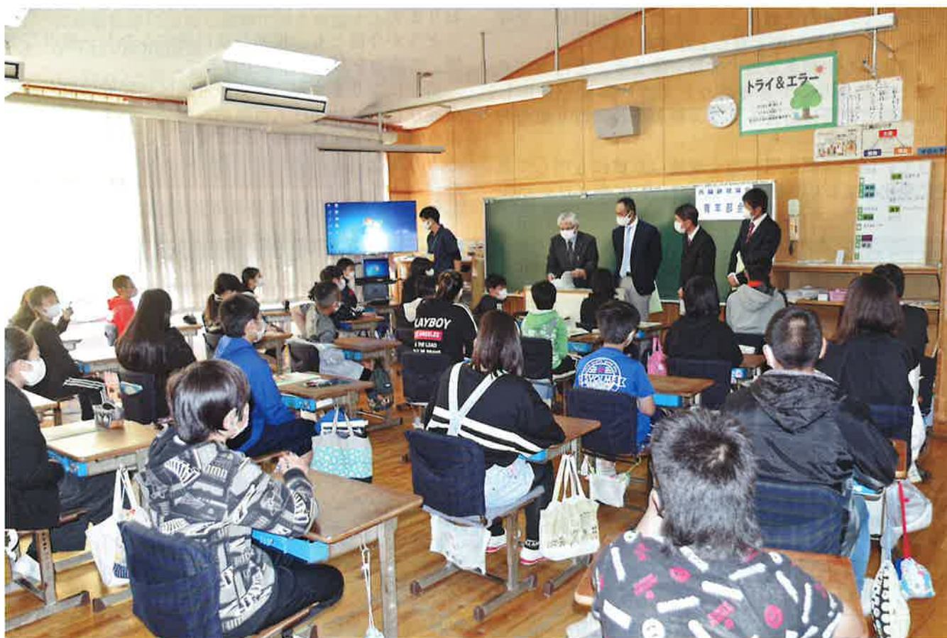
青年部会 租税教室（楠丘小学校）