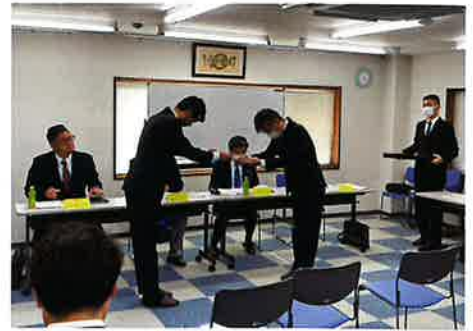
講師委嘱状交付式