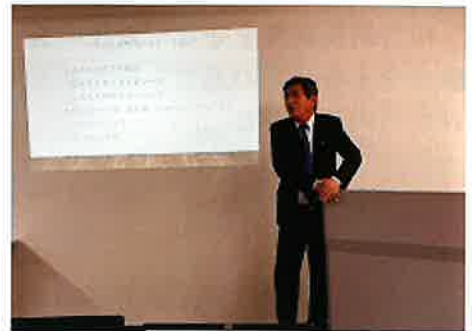
講演会「企業は生もの」