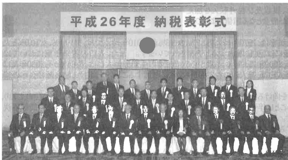
平成26年11月11日（火）ウェスティン都ホテル京都（敬称略）