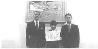
京都精華女子高等学校:12/5(金)

国税庁主催による高校生の作文募集においては、左京区内にある7つの全ての高等学校から1,159編の応募があり、平成23年度以降、全7校からの応募が続いており、平成24年度以降、応募数は1千編を超えています。