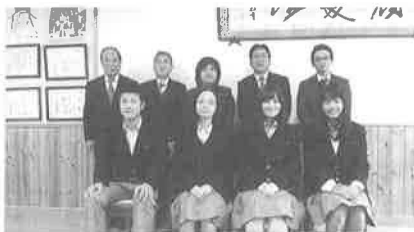
市立洛北中学校: 12/8(月)