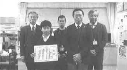
市立花香小中学校: 12/12(金)