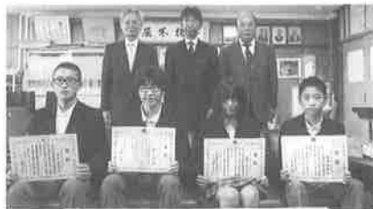
市立下鴨中学校: 12/5(金)