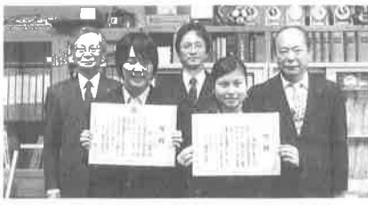
市立修学院中学校: 12/9(火)