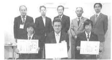
京都文教高等学校:12/10(水)