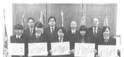
府立洛北高等学校:12/16(火)