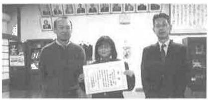
府立北稜高等学校:12/11(木)