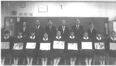
ノートルダム女学院中学校: 12/5 (金)

各中学校には、表彰区分(税務署長賞・府税事務所長賞・区長賞・税理士会支部長賞・租税教育推進協議会長賞・納税協会長賞・納税貯蓄組合連合会長賞)ごとに国・府・市の幹部職員、近畿税理士会左京支部伊良知支部長、左京納税貯蓄組合連合会村中会長、左京納税協会井上専務理事が訪問し、入賞者に賞状と副賞を授与し、応募者全員には参加賞が渡されました。