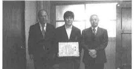
市立高野中学校: 12/12(金)