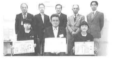
京都文教中学校: 12/10(水)