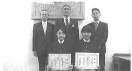
京都精華女子中学校: 12/5(金)