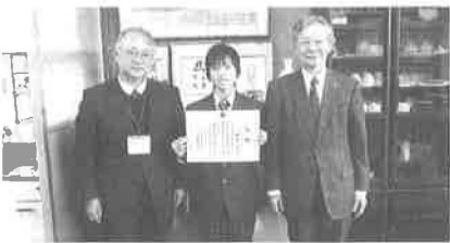
市立大原中学校: 12/10(水)