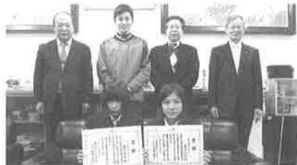
市立岡崎中学校: 12/8(月)