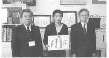
市立近衛中学校: 12/17(水)