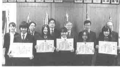
府立洛北高等学校附属中学校: 12/16(火)