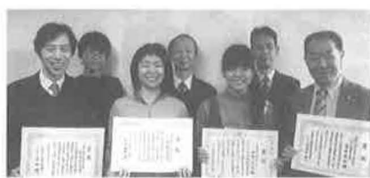
同志社高等学校:12/11(木)