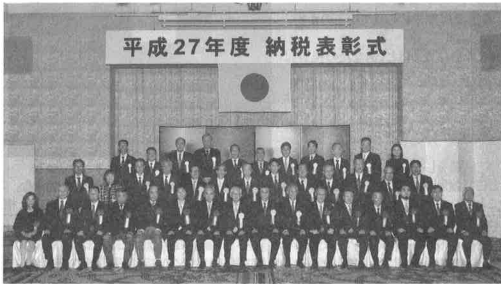
平成27年11月19日(木)ウェスティン都ホテル京都(敬称略)