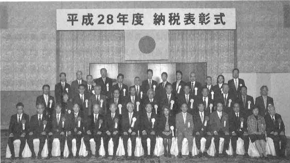
平成28年11月17日(木)ウエスティン都ホテル京都

平成28年11月28日発行 発行所 京都市左京区聖護院 円頓美町29-6 ☎ 075-771-6410 公益社団法人 左京納税協会 左京納税貯蓄組合連合会 発行人/上茶谷 博