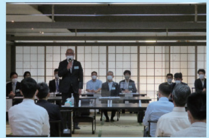
岡野新青年部会長からのご挨拶