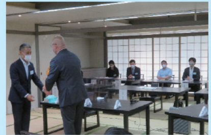
大角直前部会長への花束贈呈