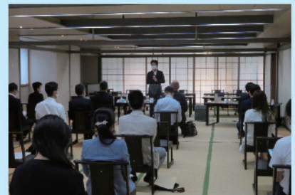
「消費税インボイス制度について」の研修会