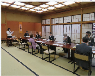
10月18日 左京優青会定時総会 10月18日 左京優青会・左京納税貯蓄組合連合会・個人部会 合同研修会、昼食会