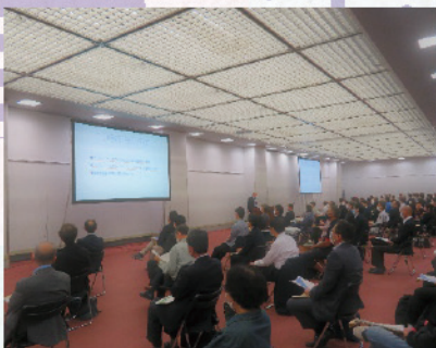
10月19日 改正法人税法等説明会