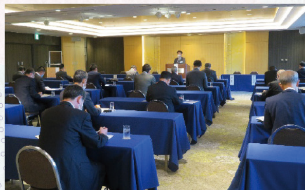
10月27日 優法会定時総会、研修会