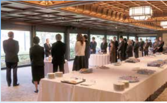
1月18日(水) 新年賀詞交歓会