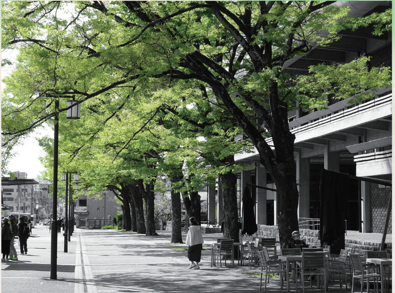
ロームシアター京都前