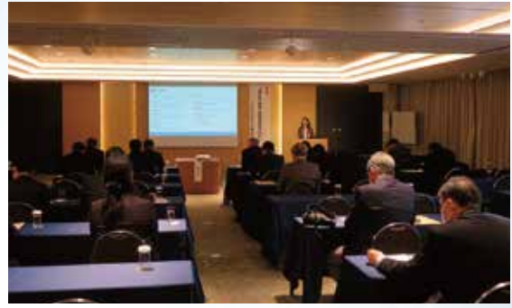
2月13日(月) 優法会・模範法人会合同研修会