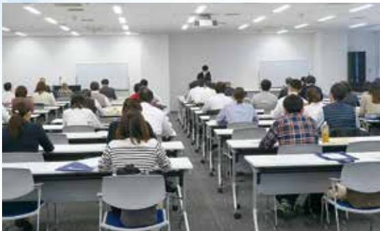
3月22日(水) 法人決算期別説明会