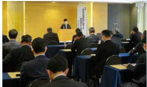
4月25日(火) 資産税部会研修会