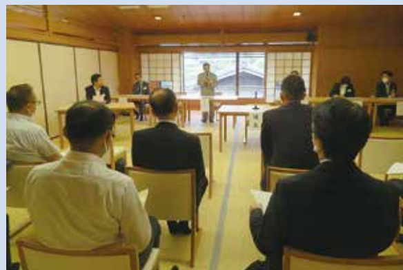
6月15日(木)「六盛」において定時総会