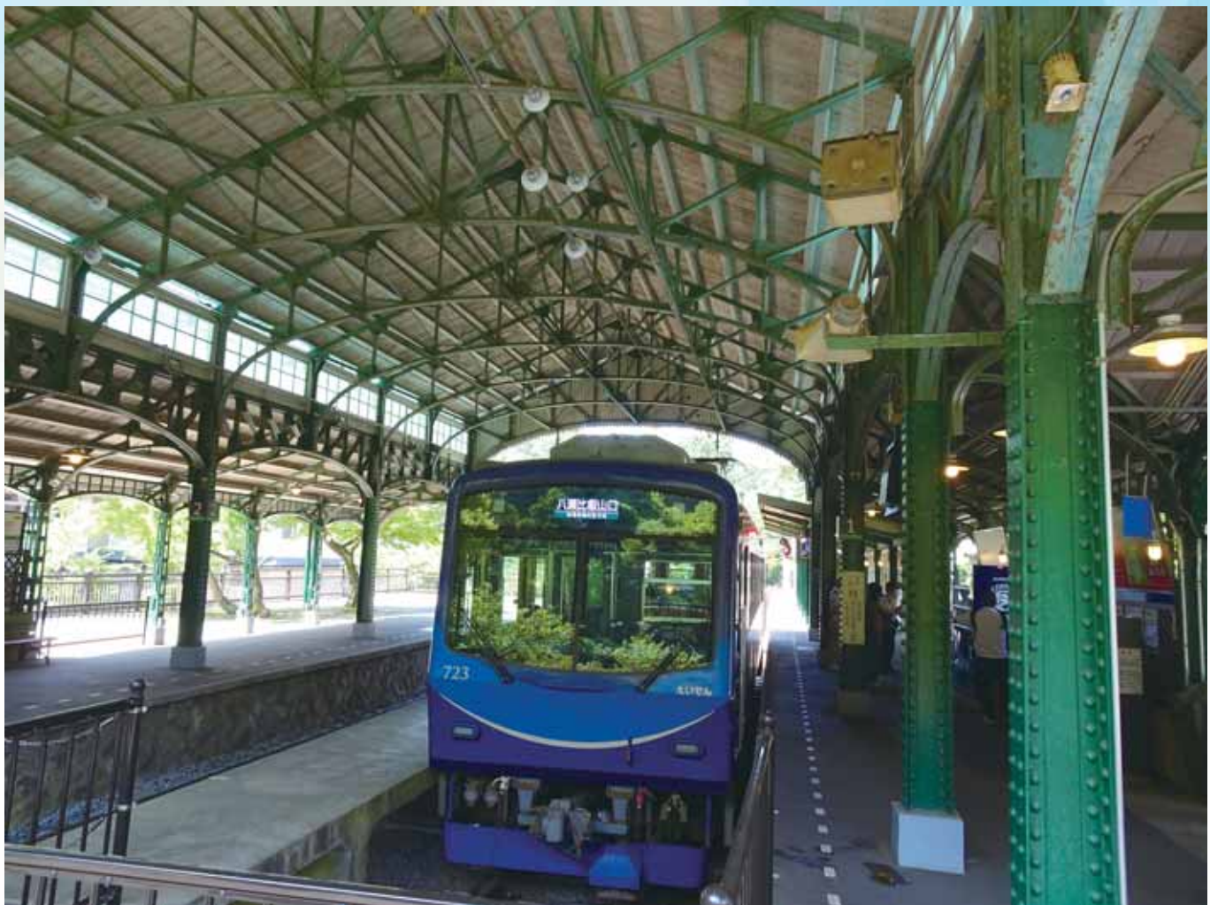
叡山電鉄 八瀬比叡山口駅

京都市左京区聖護院円頓美町29-6 公益社団法人 左京納税協会・左京納税貯蓄組合連合会 ☎ 075-771-6410 発行人/上茶谷 博