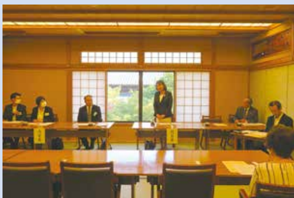
6月19日(月)「南禅寺順正」において定時総会