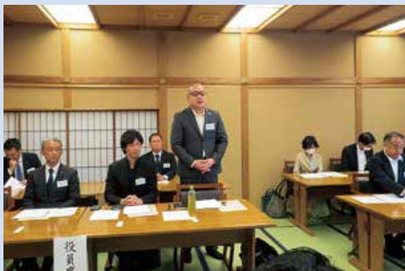
6月13日(火)「南禅寺順正」において全体会議