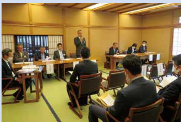
6月27日(火)「南禅寺順正」において定時総会