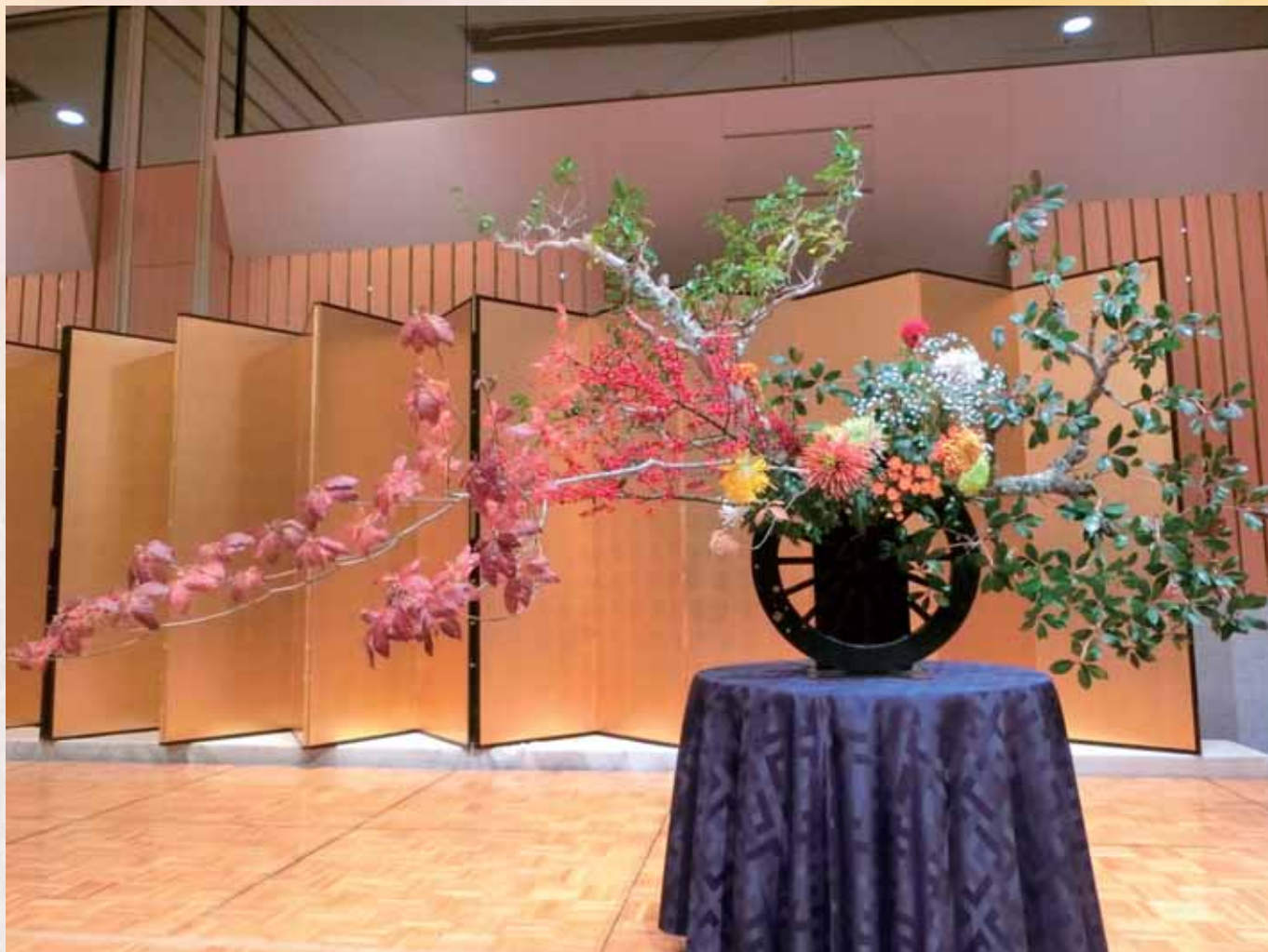
未生流笹岡家元の作品 / 青年の集いにおける生花パフォーマンス

京都市左京区聖護院円頓美町29-6 公益社団法人 左京納税協会・左京納税貯蓄組合連合会 ☎ 075-771-6410 発行人/山本 真澄