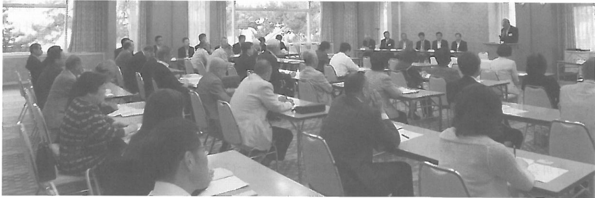
(シーバル須磨における定時社員総会の模様)