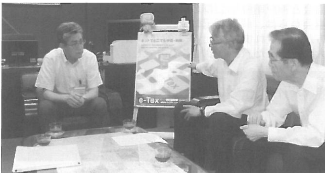
(左から林署長、加古協会会長、伊藤納貯会長)