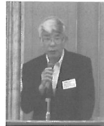
加古納税協会会長