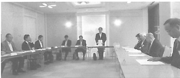
(須磨納税貯蓄組合総会の模様)