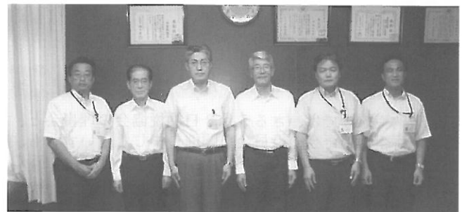
(税務署幹部のみなさん)