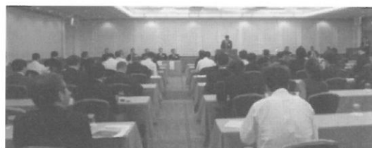
(H25.10.2) 神戸市内青年部会研修会