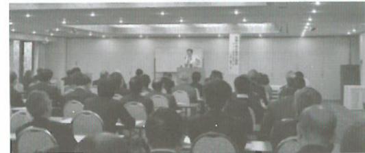
(H25.12.10) 大阪国税局調査第1部長講演会