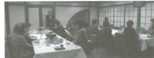
(H25.12.13) 女性部税務研修会