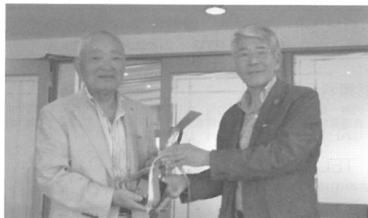
(H25.9.13) 第6回親睦ゴルフ大会