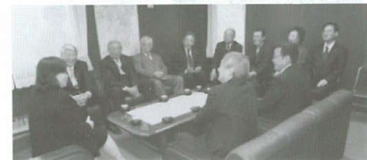
(H26.1.7) 税務署新年表敬訪問