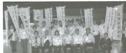
(H25.11.9) 税を考える週間行事「スマスイモ税を考える」