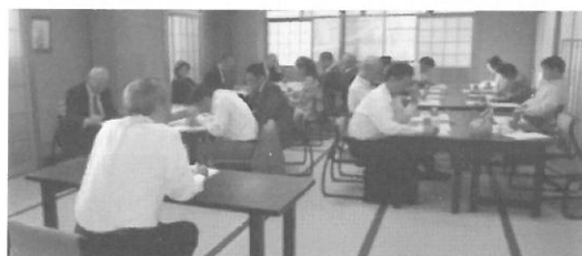
(H25.9.27) 法優会税務研修会