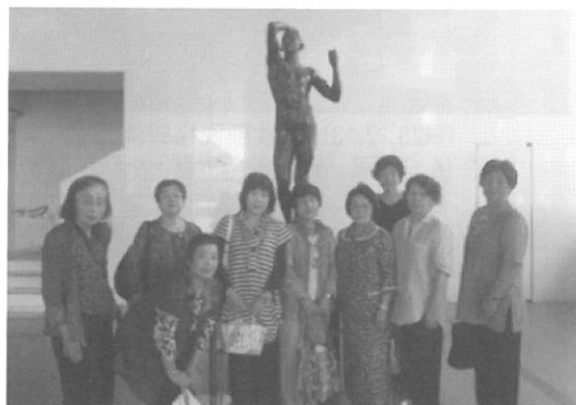
(H25.9.10) 女性部 市議会見学