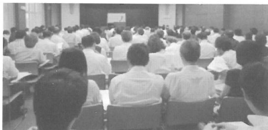
(H25.8.28) 改正消費税法研修