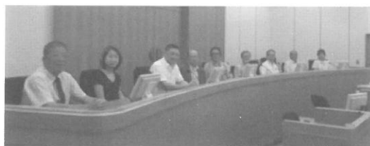
(H25.9.19) 税青会、裁判所見学