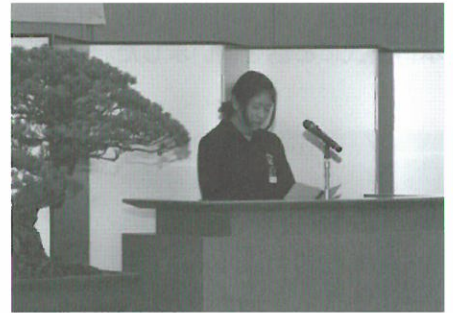
(納税表彰式で作文を朗読する青柳さん)