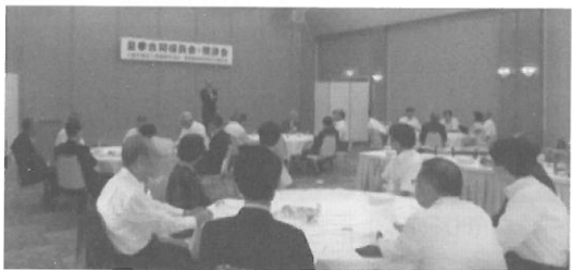
(H25.7.24) 協会・納貯合同役員会