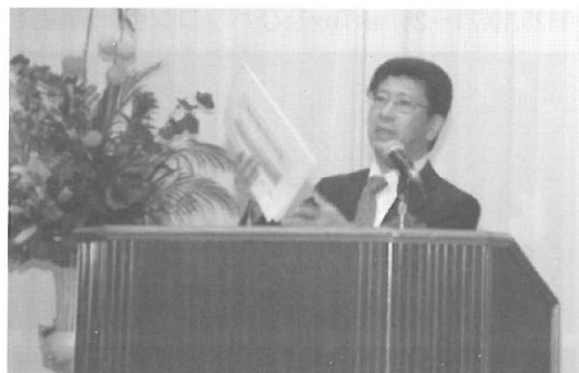
(H25.9.26) 大阪国税局長講演会