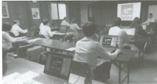
(H25.10.21~25) e-Tax及びパソコン会計講習会