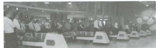
(H25.12.3) 三者共催ボウリング大会