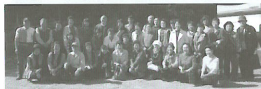
(H25.10.28) 秋季バス研修ツアー