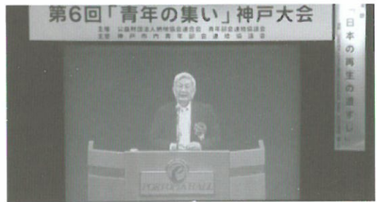
(H25.11.27) 青年の集い「神戸大会」