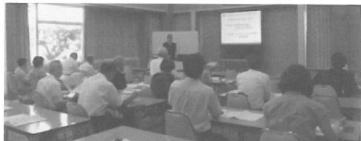
(H25.7.24) 医療健康セミナー