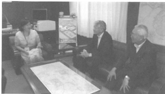
(H25.7.16) 両会長、新任署長との対談