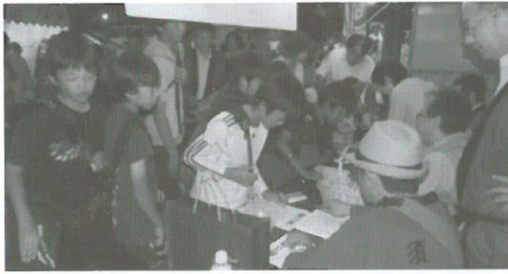
(H25.10.11) 海神社秋祭りでの税金クイズ