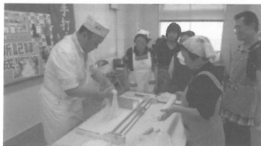
(H25.9.24) うどんづくり体験