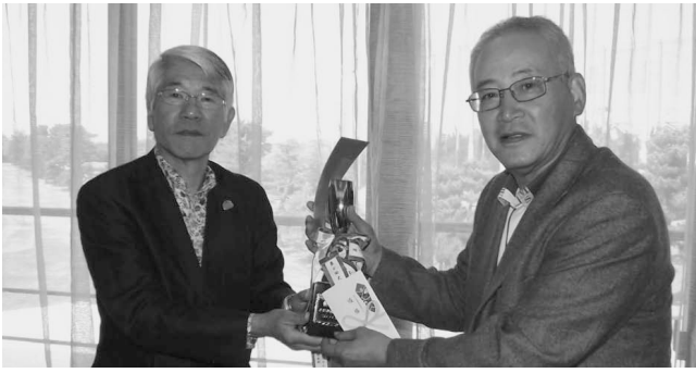
第7回須磨納税協会親睦ゴルフ大会(H26.4.24)