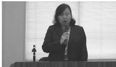
（辻税務署長あいさつ）