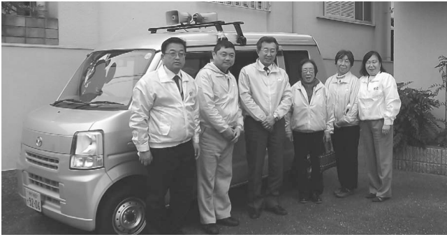
確定申告申告期の広報車（H26.2.3～2.21）