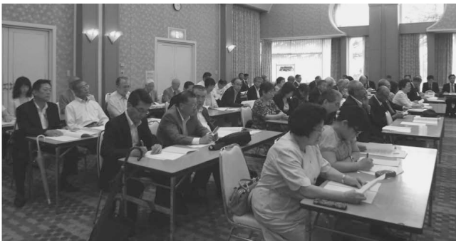
第4回定時社員総会 (H26.6.12)