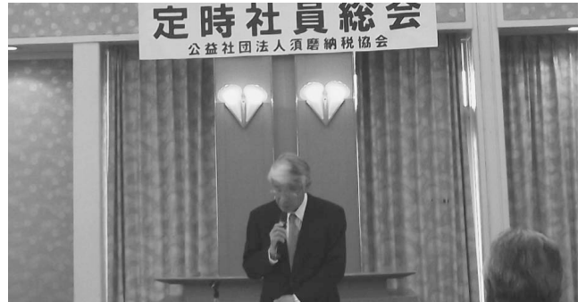
第4回定時社員総会加古会長あいさつ (H26.6.12)