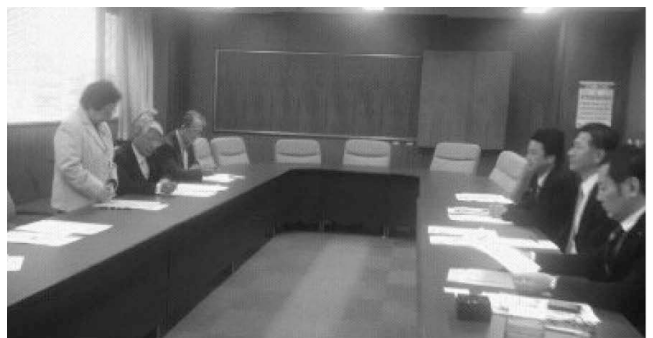
平成26年度第1回福祉制度委員会（H26.4.18）