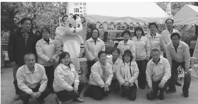
さくら祭り・妙法寺川公園（H26.4.5）