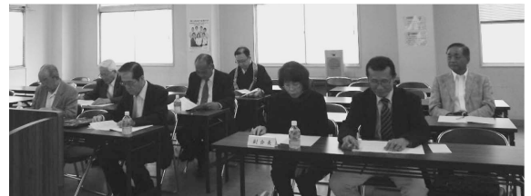
（須磨納税貯蓄組合連合会総会の模様）