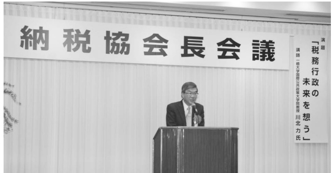
納税協会長会議・元国税庁長官講演会(H26.3.25)