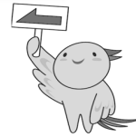
兵庫県マスコット はばタン

事業を行う個人に対しては、原則として、 所得税(国税)、住民税(市町が課税) のほかに、 県税として、個人事業税 が課税されます。