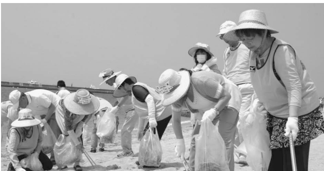
須磨海岸クリーン作戦参加 (H26.6.30)