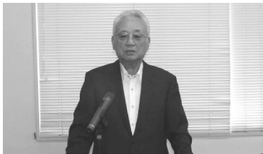
（大西連合会長あいさつ）