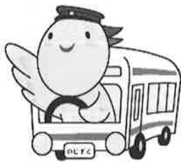
兵庫県マスコットはばタン