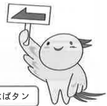
兵庫県マスコットはばタン

お問い合わせ先 西神戸県税事務所 課税第1課 ☎ (078) 737-2373 (直通)