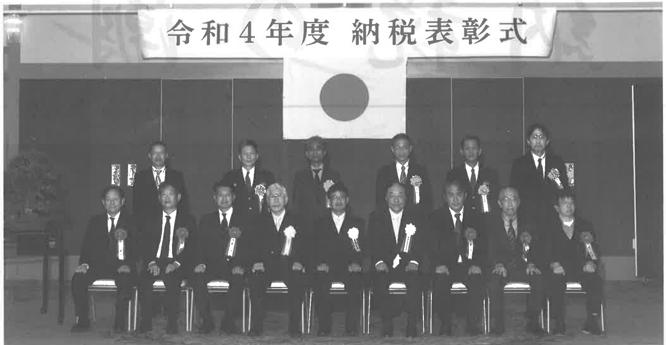
令和4年度 納税表彰式 令和4年11月15日 ☆シーサイドホテル舞子ビラ神戸

公益社団法人須磨納税協会では、さる11月15日（火）、シーサイドホテル舞子ビラ神戸において、令和4年度納税表彰式（須磨税務署・公益社団法人須磨納税協会・須磨納税貯蓄組合連合会の三者共催）が3年ぶりに挙行されました。