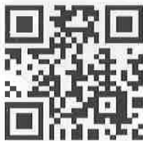
【確定申告書等作成コーナー】