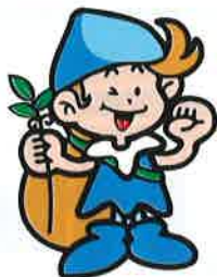
森の妖精/ネーチャ

http://www.higashimaru.co.jp/ 播磨の名水&うすくちしょうゆ発祥の地:兵庫県たつの市ヒガシマル醤油株式会社