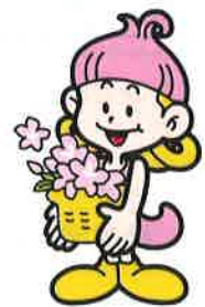
森の妖精/サッキー