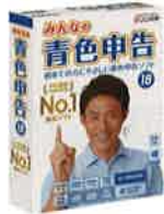
みんなの青色申告18