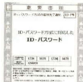
ID・パスワード方式の利用については、裏面をご覧ください。

※マイナンバーカード及びICカードリーダーライターが普及するまでの暫定的な対応です。