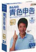
みんなの青色申告19