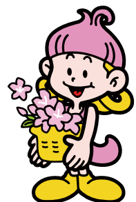
森の妖精/サッキー