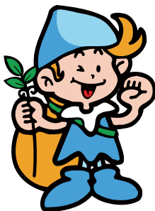
森の妖精/ネーチャ

http://www.higashimaru.co.jp/ 播磨の名水&うすくちしょうゆ発祥の地:兵庫県たつの市ヒガシマル醤油株式会社