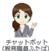
チャットボット (税務職員ふたば)