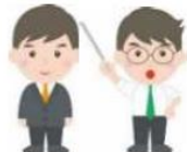
◇ 2以上の勤務先からの給与所得