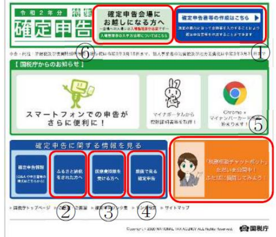
【確定申告特集ページトップ画面】