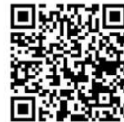
↑ 確定申告特集ページはこちら

また、マイナンバーカードなどをお持ちでない方も、税務署から発行された e-Tax 用の ID・パスワードで e-Tax ができます。