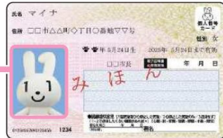
< おもて面 >