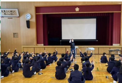
1月18日神部小学校(土井氏)