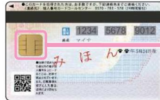
< うら面 >

うら面のICチップに あなた本人である ことを証明する、 「電子証明書」 が入っているよ!