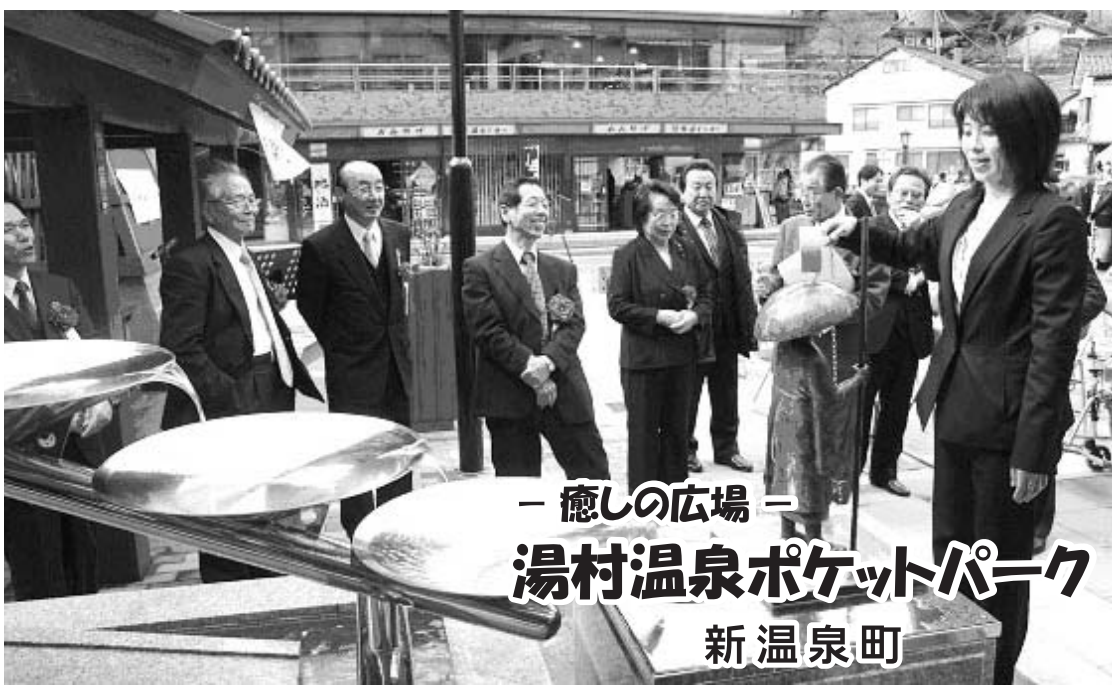
— 癒しの広場 — 湯村温泉ポケットパーク 新温泉町