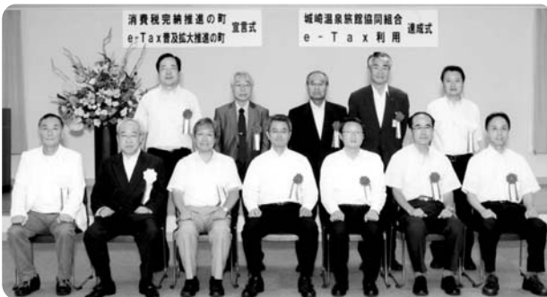
出席者による記念撮影