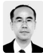
豊岡県税事務所長